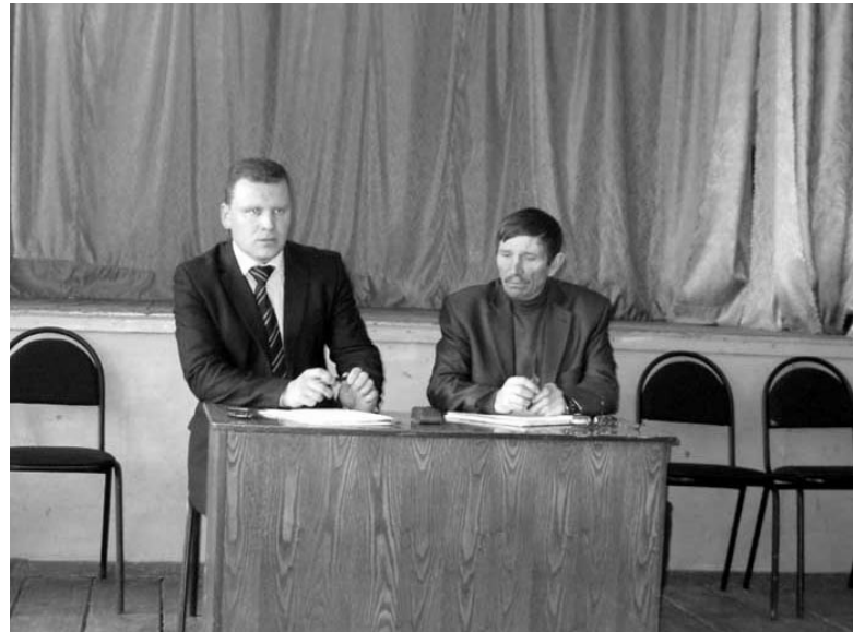
На сходе в селе Бабынино.